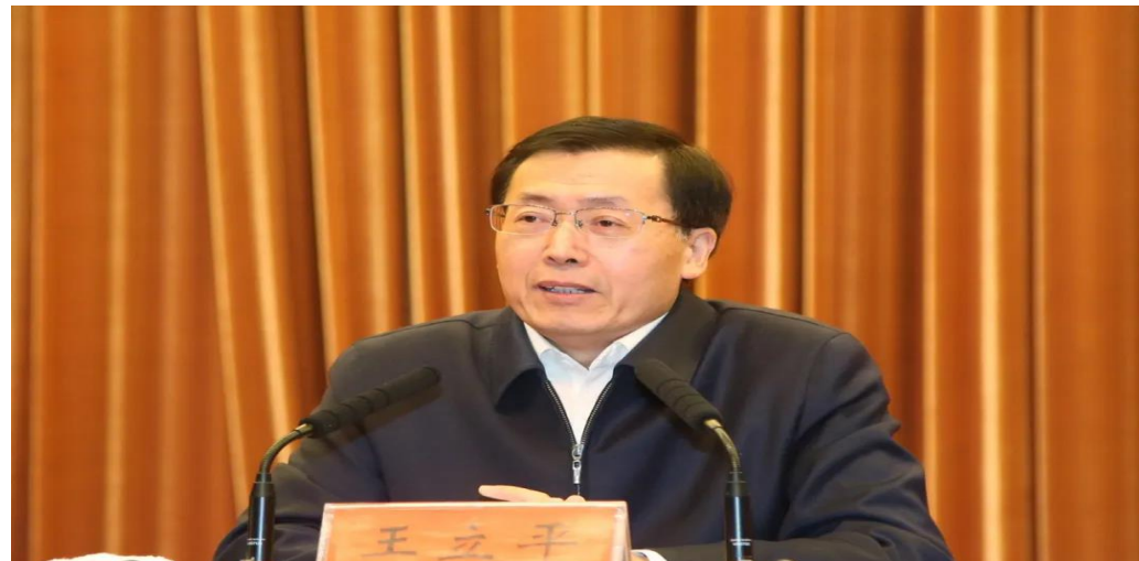
省委宣讲团成员、省委组织部常务副部长王立平来常作宣讲报告