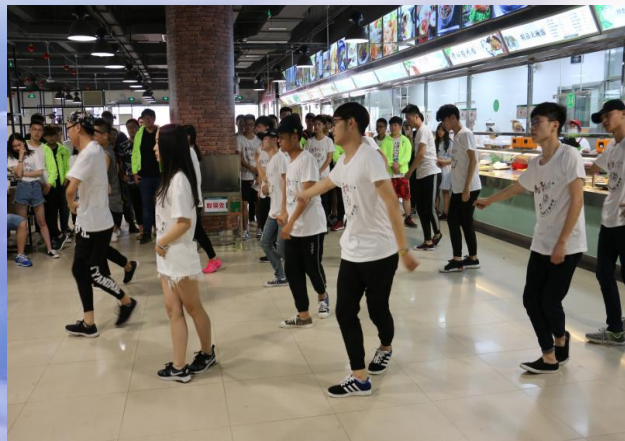
“校园分手，江湖再见” 送给毕业生的“留恋”快闪活动