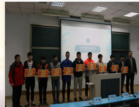
优秀文明宿舍表彰大会