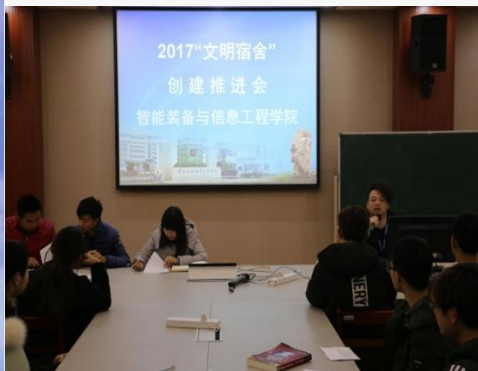
文明宿舍创建推进会